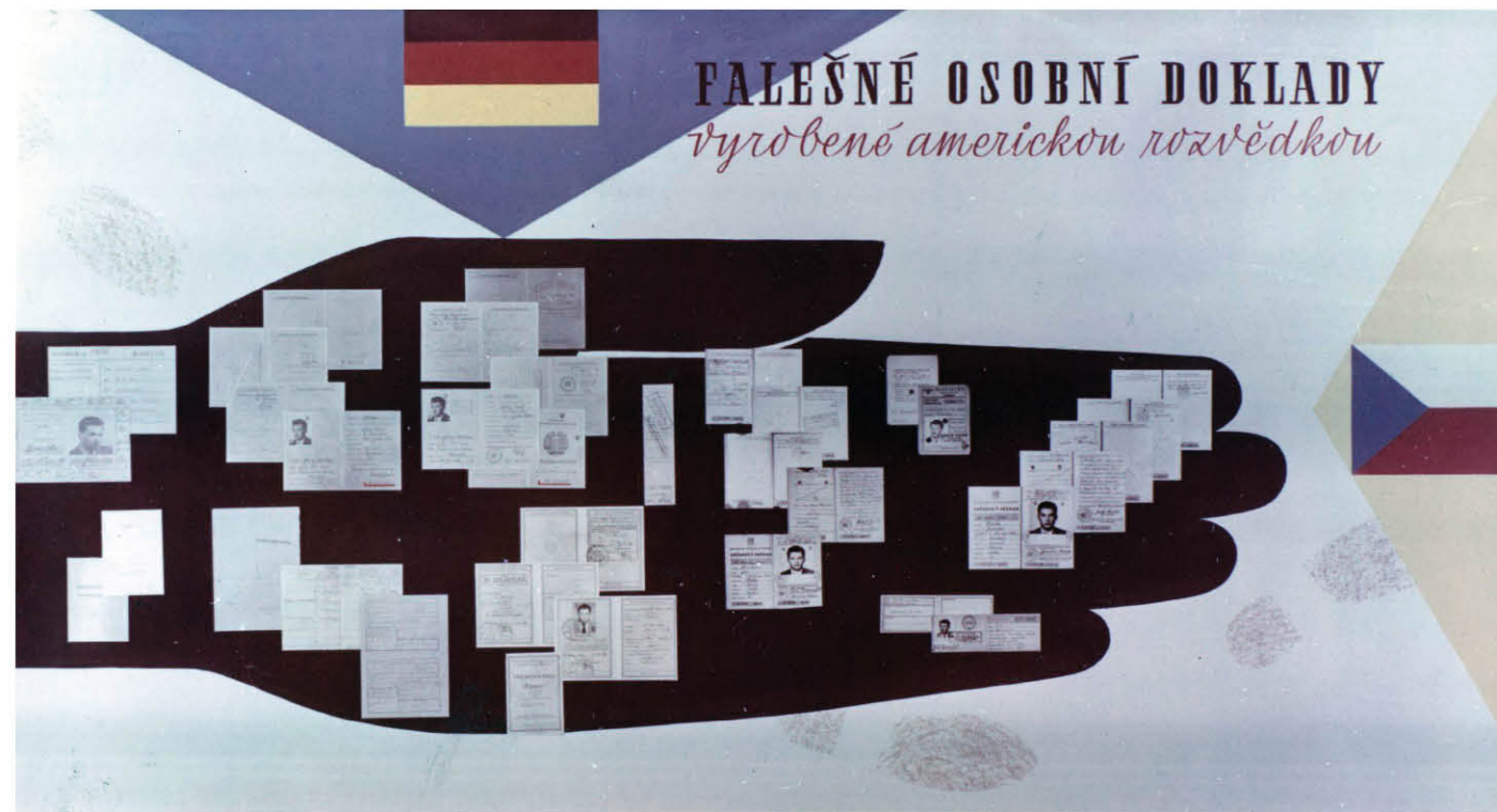
Fotografie panelů výstavy Státní bezpečnosti z 60. let k akci Východ. Photographs of panels from the 1960s StB exhibition on Operation "East".