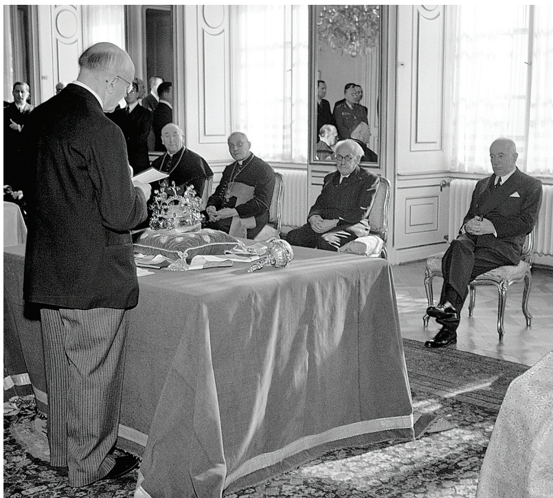
České korunovační klenoty v Trůnním sále Pražského hradu po jejich vyzvednutí z podzemí Starého královského paláce 24. října 1945. Na snímku stojící kancléř Jaromír Smutný, sedící zprava prezident Edvard Beneš a ministr školství a osvěty Zdeněk Nejedlý.

Navzdory různým tvrzením, poloprávdám a legendám byli příslušní úředníci Háchovy prezidentské kanceláře a Hospodářské a Stavební správy Pražského hradu po celou dobu dobře informováni o tom, kde se klenoty nacházejí. O jejich osudu v letech 1939–1945 byl také při svém návratu na Pražský hrad 16. května 1945 informován prezident Edvard Beneš. Z podzemí Starého královského paláce byly klenoty vyjmuty až 24. října 1945. Po jejich prozkoumání a vystavení v katedrále svatého Víta společně s korunovačním křížem a tzv. svatováclavským mečem ze svatovítského chrámového pokladu ve dnech 25. až 30. října byly 31. října 1945 uloženy v Korunní komoře svatovítského chrámu. Jejich navrácení do katedrály svatého Víta udělalo symbolickou tečku za neklidným obdobím Pražského hradu v letech 1939–1945. 53