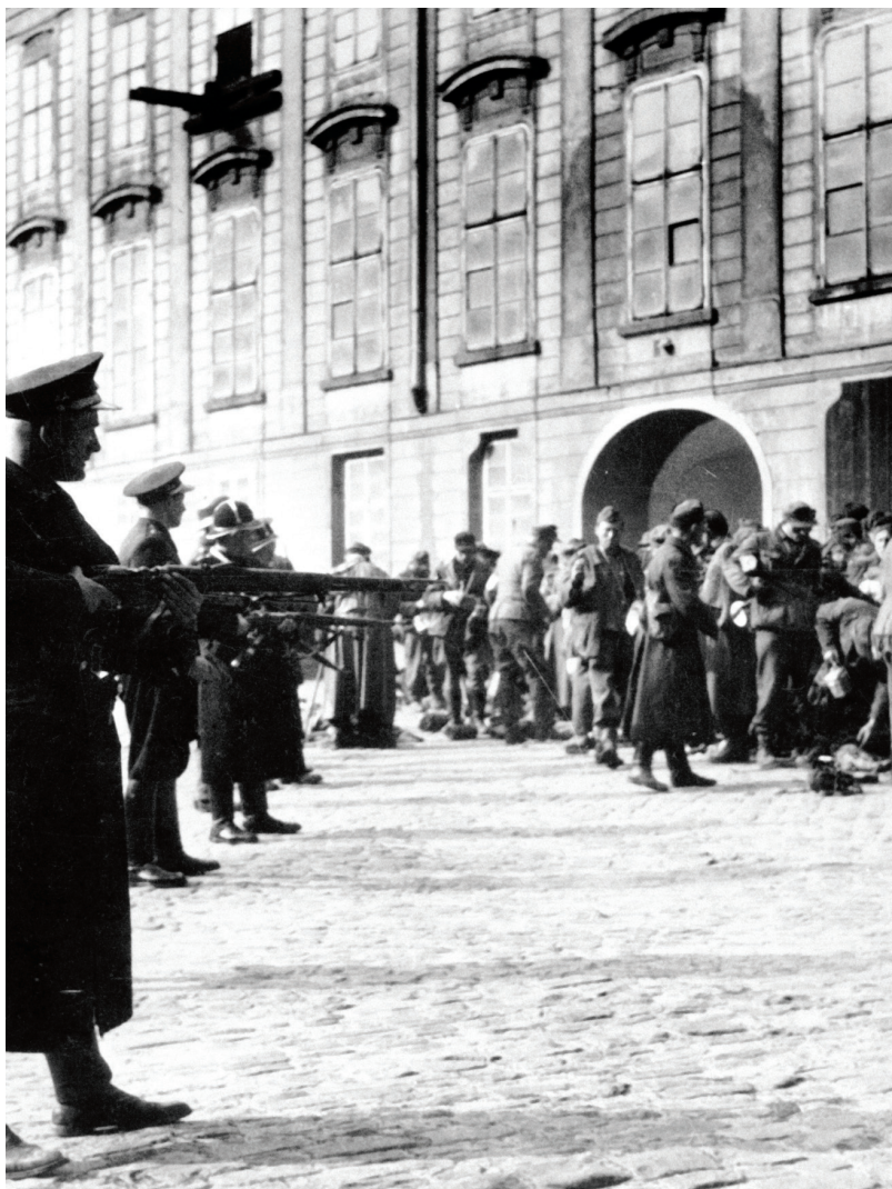
Zajatí němečtí vojáci na Pražském hradě, 9. května 1945