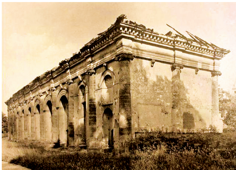
Vyhořelá Míčovna Pražského hradu, 1945