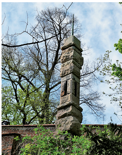
Pomník civilistům zavražděným u Pražského hradu 8. května 1945

200–250 dětem a dospělým oznámili, že má dojít k útoku povstalců na Hrad, proto že budou propuštěni dolů do města. Současně jim vyhrožovali smrtí, pokud se bude znovu opakovat střelba na německé vojáky. Nakonec museli všichni zůstat na Hradě až do 9. května, aniž by se jim něco stalo.