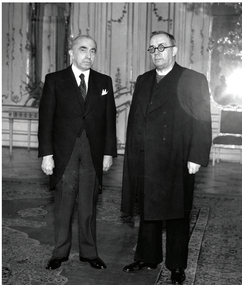
Emil Hácha a Avgustyn Vološyn (vpravo) při setkání 10. prosince 1938. Dva muži, kterým nejvyšší funkce vnutil spíše osud. Oba zemřeli ve vězeňské nemocnici.

zeno po krátkou dobu jeho vrcholné politické kariéry nosit masku lidového vůdce, který oslavuje hvězdnou chvíli svého národa a hodlá jej provést zmat-