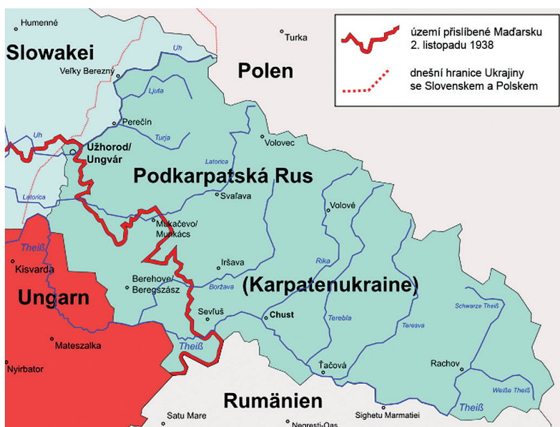
Mapka zachycující územně-politické změny po vídeňské arbitráži