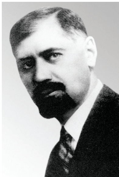
Andrej Bródy, premiér první vlády autonomní Podkarpatské Rusi. Ze tří premiérů podkarpatských vlád unikl sovětské pomstě jen Julian Révay.

tá s vypjatou čechofobií ukrajinských autonomistických politiků, v roce 1937 předkládal Praze návrh na vydávání ukrajinsky psaného deníku, jenž svým ostřím zahrocen nekompromisně jak proti maďarské a polské propagandě [...] ve smyslu odtržení Podkarpatské Rusi od republiky, tak proti jejich službičkářům v zemi – měl by za úkol potírat i s veškerou rozhodností a s projevy loajality neotálel ještě na jaře 1938, právě jako Avgustyn Vološyn, prominentní politik nadcházející éry. 10 Skutečnost, že zde do nejistého období vkračeli Češi bez spojenců, padá na vrub jejich neschopnosti odhlédnout od výstřelků extremistů a osmělit se k ústupkům ve věci ustavičně odkládané autonomie v součinnosti právě s demokratickými Ukrajinci. 11 V případě, kdy byl tento požadavek vzněšen ústy rusofilského tábora, bylo nasnadě, že jde o rafinovanou práci ve prospěch Budapešti, což posilovalo české obavy z neblahého