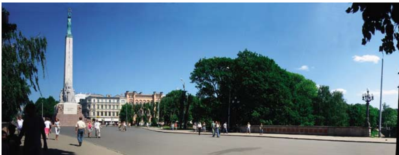
Prostranství před památníkem Svobody v Rize, místo Ripsova činu