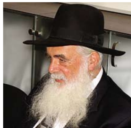
Elijahu Rips na Velvyslanectví České republiky v Tel Avivu v srpnu 2008

Přitahovala mě matematika, kterou učil můj otec. Zúčastnil jsem se řady matematických soutěží, od těch místních v Rize a Lotyšsku až po národní v Rusku a Sovětském svazu. Tuším, že to bylo v roce 1964, kdy jsem se zúčastnil mezinárodní matematické olympiády v Moskvě. Po této soutěži mě přijali na Lotyšskou státní univerzitu v Rize. Studoval jsem matematiku na Fakultě matematiky a fyziky. Zabýval jsem se algebrou a setkal jsem se zde s vynikajícím profesorem Borisem Plotkinem, který se později stal mým učitelem. Je to muž s mnoha