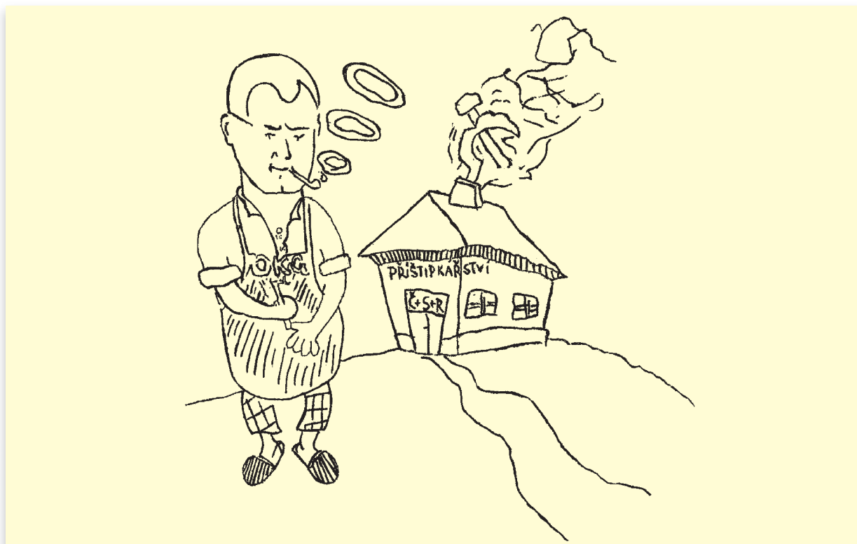
Karikatura Klementa Gottwalda byla součástí druhého čísla časopisu Za pravdu .